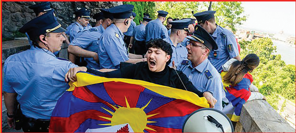
हंगरी के बुडापेस्ट में गेलर्ट हिल पर तिब्बती झंडे के साथ चीनी राष्ट्रपति शी जिनपिंग की यात्रा का विरोध करते समय हंगरी पुलिस द्वारा घेर लिए जाने पर आक्रोश में चिल्लाता हुआ तिब्बती प्रदर्शनकारी ।