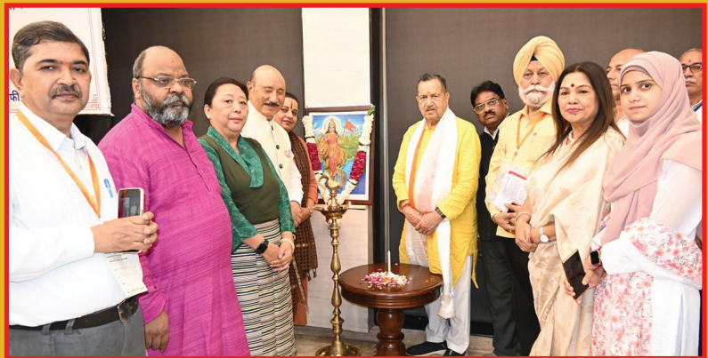
सभा में मौजूद भारत-तिब्बत सहयोग मंच के सदस्य और तिब्बती स्थानीय समुदाय ।